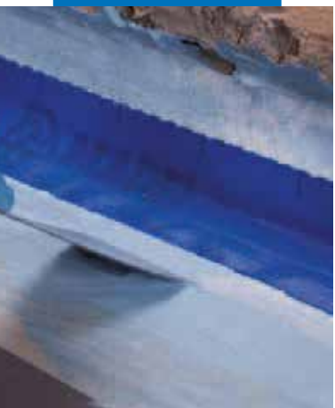
Укладка Mapeband на галтель примыкания стена-пол с помощью Mapelastic AquaDefense