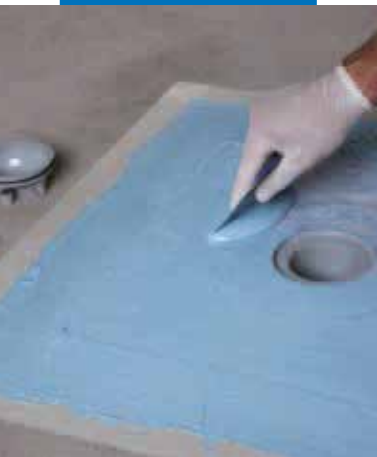
Пропитка полотна Drain Vertical при помощи Mapelastic AquaDefense