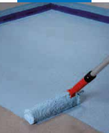
Нанесение первого слоя Mapelastic AquaDefense на стяжку

и мощных средств, которые обычно используются для очистки жилых помещений.